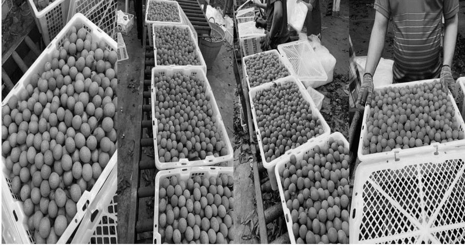
【圖六】中國商人以目測判定龍眼的品質，而判斷出新鮮龍眼出現混淆問題 43