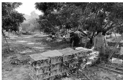
【圖三、四、五】中國商人跟龍眼果農承包龍眼果園 41